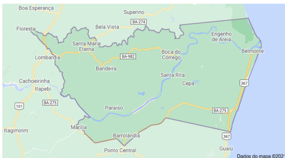
Figura 3: Mapa do município e dos distritos

As principais rodovias de acesso para Belmonte são a BA-001, que faz a ligação entre Belmonte e Porto Seguro e a BA- 275 que liga a BA-001 à BR-101. Saindo de Porto Seguro, percorrendo 23 km na direção norte pela rodovia BR-367, até a cidade de Santa Cruz Cabrália. Em Cabrália, você pode atravessar numa balsa o rio João de Tiba, até o atracadouro de Santo André. Depois, você pode seguir por mais 51 km pela rodovia BA-001 até Belmonte .