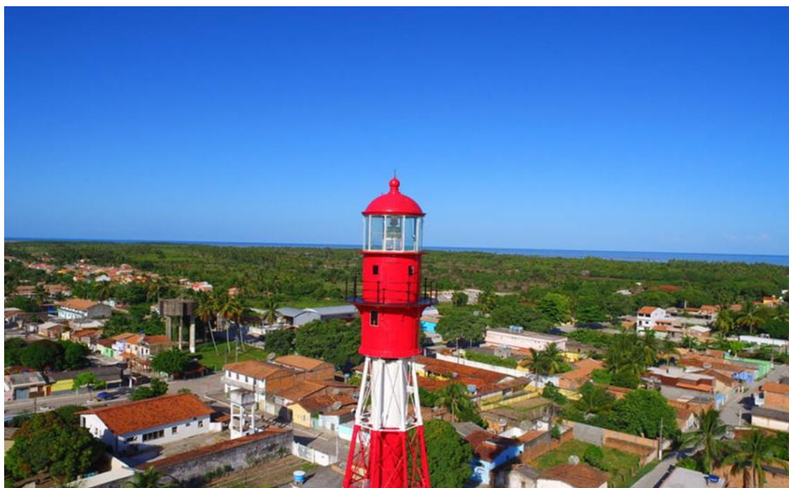
FIGURA 1 – FAROL

Atualmente o município de Belmonte subdivide-se nas localidades da sede e os distritos de Boca do Córrego e Mogiquiçaba, Santa Maria Eterna e Barrolândia. No centro da cidade está localizado um imponente farol, construído pela mesma empresa que construiu a Torre Eiffel.