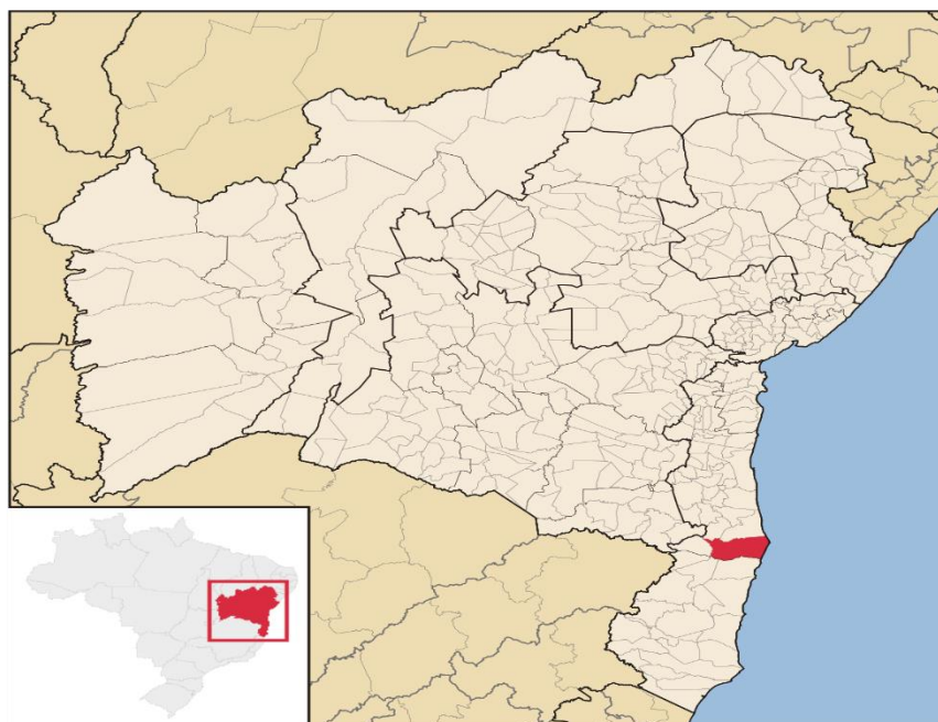
Figura 2: Localização de Belmonte no estado da Bahia

As principais rodovias de acesso para Belmonte são a BA-001, que faz a ligação entre Belmonte e Porto Seguro e a BA- 275 que liga a BA-001 à BR-101. Saindo de Porto Seguro, percorrendo 23 km na direção norte pela rodovia BR-367, até a cidade de Santa Cruz Cabrália. Em Cabrália, você pode atravessar numa balsa o rio João de Tiba, até o atracadouro de Santo André. Depois, você pode seguir por mais 51 km pela rodovia BA-001 até Belmonte .