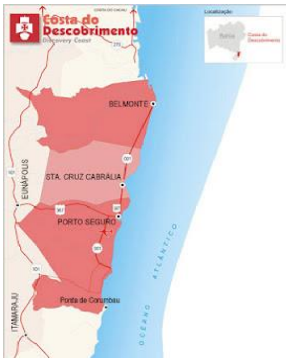
Figura 1- Mapa da Costa do Descobrimento, estado da Bahia

O município de Belmonte está localizado na Costa do Descobrimento, no estado da Bahia, estando a uma altitude de 8 metros. Sua população estimada em 2018 era de 23 214 habitantes. Possui uma área de 2016,85 km 2 .